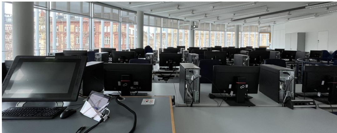
Raumansicht nach vorne / nach hinten