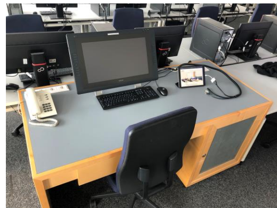
Pult mit Interaktivem Stift-Display