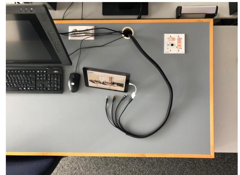
Pult mit interaktivem Stift-Display, Anschlusskabeln & Bedienfeld