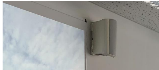
Lautsprecher neben der Leinwand

Die Bedienung der Geräte erfolgt über das Bedienfeld rechts oben im Pult. Selbst mitgebrachte Geräte schließen Sie am Kabelbaum auf dem Pult an.