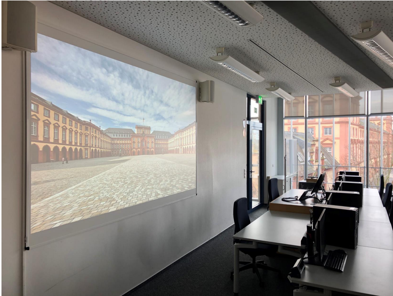
Raumansicht auf Leinwand, Pult und Lautsprecher