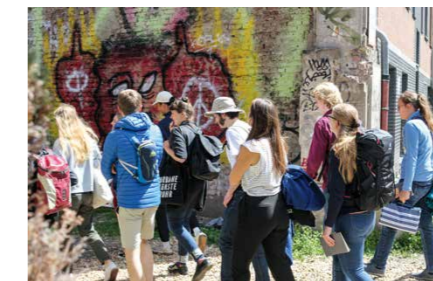
Kunst schaffen, Kunst erleben, Kunst entdecken – der 19. Jahrgang des Bronnbacher Stipendiums hat im Laufe des Stipendienjahres viel erlebt