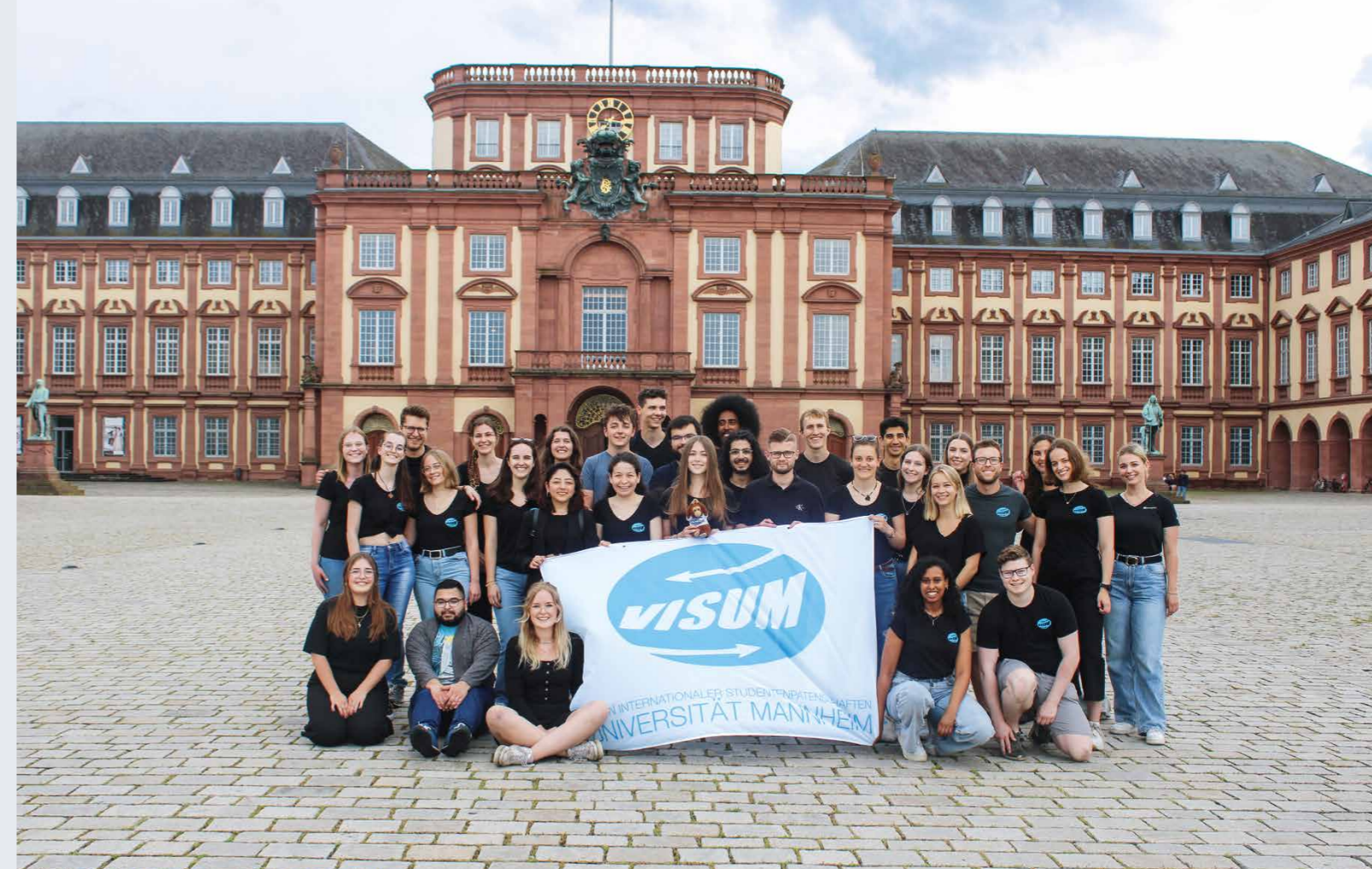
VISUM unterstützt bereits seit 30 Jahren internationale Studierende bei ihrem Start in Mannheim

Das Konzept der bereits seit 1992 bestehenden Initiative ist einfach: Auf ihrer Webseite gibt es zwei Formulare – eins für deutsche Studierende, die sich mindestens ein Semester lang als Buddy zur Verfügung stellen, und eins für internationale Studierende, die gerne einen deutschen Buddy an ihrer Seite hätten. Im Formular können Interessierte Informationen über sich sowie eine Sprache angeben, die ihr Buddy neben Englisch möglichst auch sprechen sollte. „Wir versuchen, den Sprachwunsch bei so vielen Studierenden wie möglich zu erfüllen, aber können das leider nicht garantieren“, erklärt Ibrahim. Nachdem sie deutsche und internationale Studierende zusammengebracht haben, erhalten beide eine E-Mail mit den Kontaktdaten ihres jeweiligen