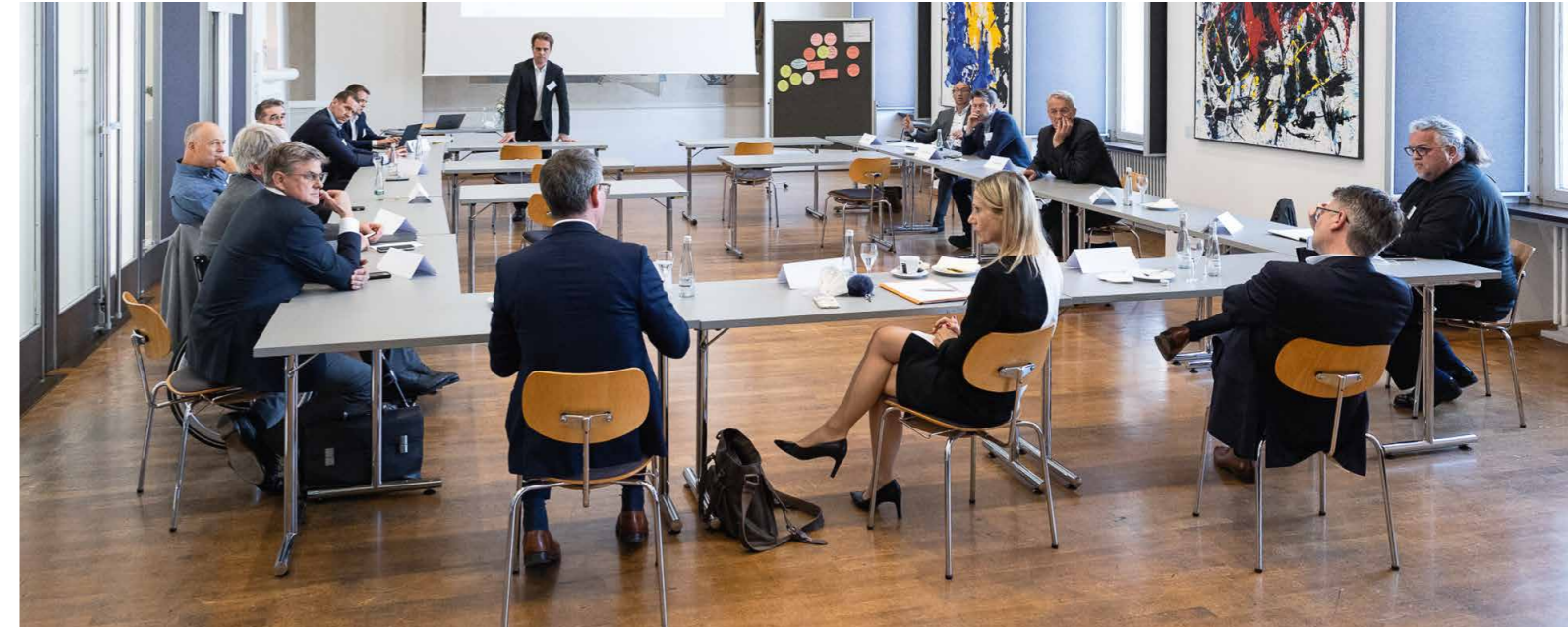
In Arbeitsgruppen wurde bei der Auftaktveranstaltung des Data Science-Arbeitszirkels eifrig diskutiert

zu Wettkämpfen sowie Trainingslager nicht mehr durch die Vereine getragen werden. Deshalb sind wir sehr dankbar, dass wir mit der Unterstützung durch das Private Banking der BNP Paribas unseren StipendiatInnen finanziell unter die Arme greifen können.“ Die Stiftung Universität Mannheim erhält zunächst über fünf Jahre eine Förderung der BNP Paribas Wealth Management - Private Banking.