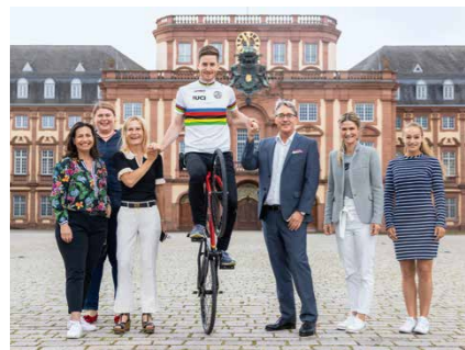
Die Mittel aus dem Sozialfonds kommen studierenden Spitzensportlerinnen und Spitzensportlern an der Universität Mannheim zugute