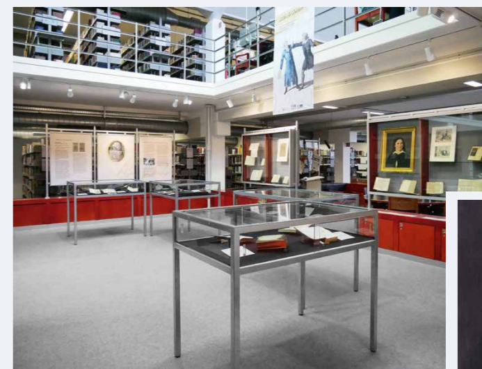
Im Bibliotheksbereich A3 wird die Ausstellung „Kosmos Desbillons“ ab dem Frühjahr zu bestaunen sein

Aktuelle Kurse: www.uni-mannheim.de/sport/