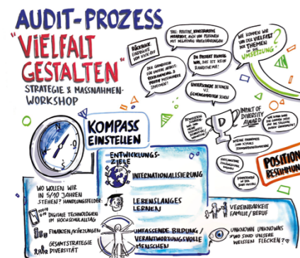
Beim Audit "Vielfalt gestalten" sind Ideen gefragt