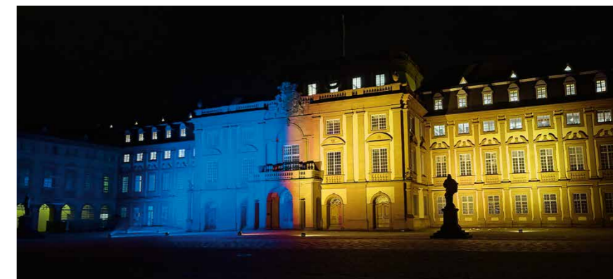
Das Barockschloss leuchtet in den Farben der Ukraine