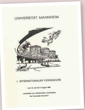
Titelblatt des Programms für den ersten internationalen Ferienkurs der Uni Mannheim (UA MA 117 Nr. 2)

Diese Erkenntnis, geäußert vom langjährigen Leiter des Akademischen Auslandsamts (AAA) zu Anfang der 1970er Jahre, drückte sich schon zu Zeiten der Handelshochschule (1907-1933) in den Aktivitäten der einzelnen Fachbereiche aus.