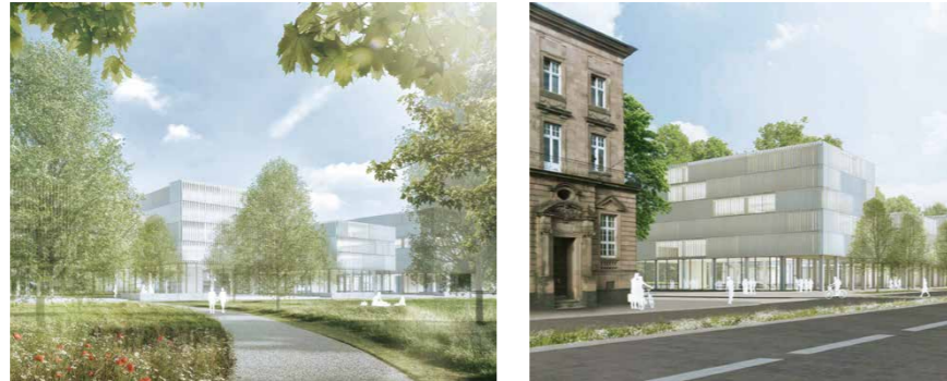
Der Friedrichspark, wie er in Zukunft aussehen könnte / Foto: Architekturbüro Hähmig und Gemmeke Freie Architekten BDA