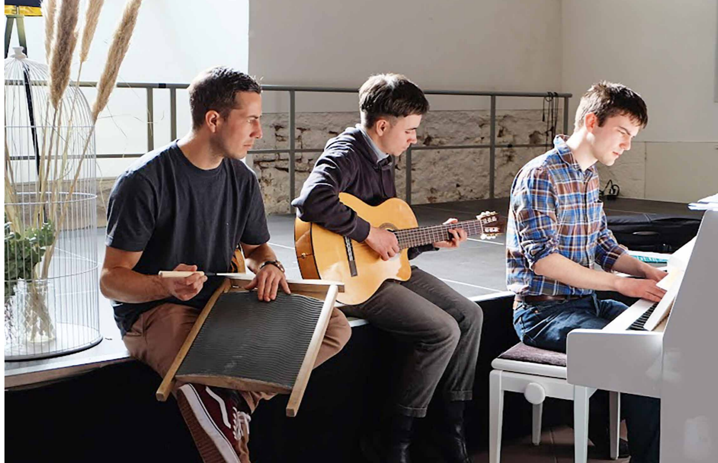
Beim Eröffnungswochenende musizierten die Stipendiatinnen und Stipendiaten gemeinsam