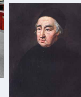
Der Jesuitenpater Desbillons