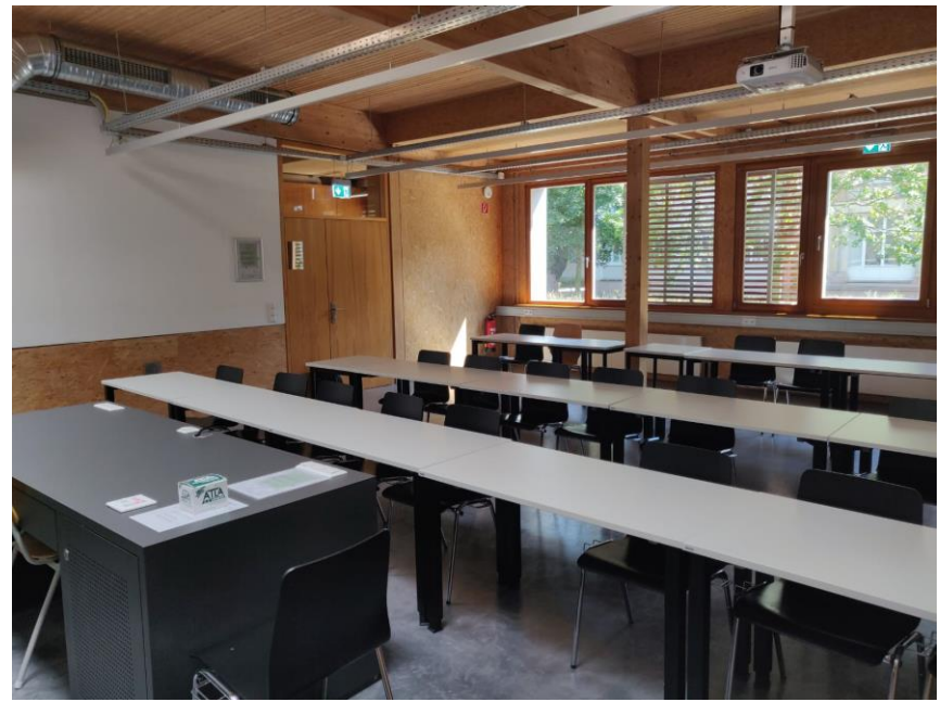
Anschlüsse VGA, HDMI und Audioklinke