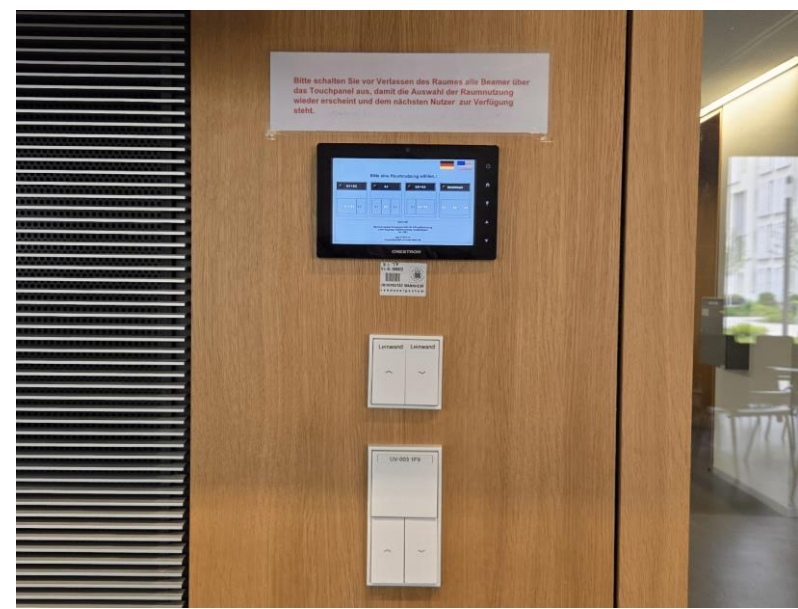
Touchpanel , Schalter für Licht, Leinwand und Jalousie