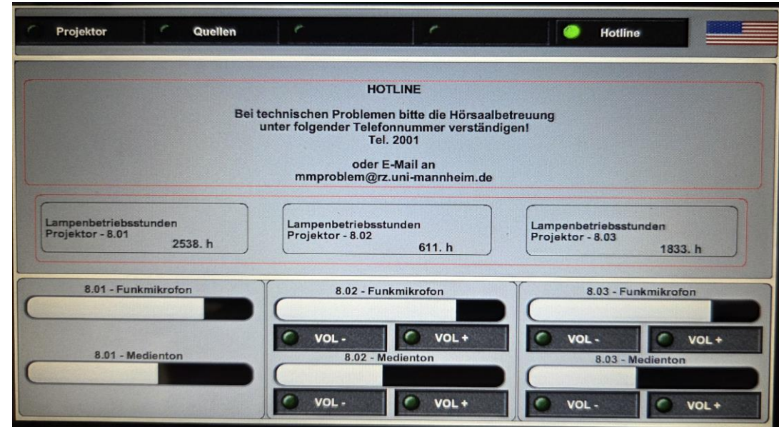
Support / Hotline