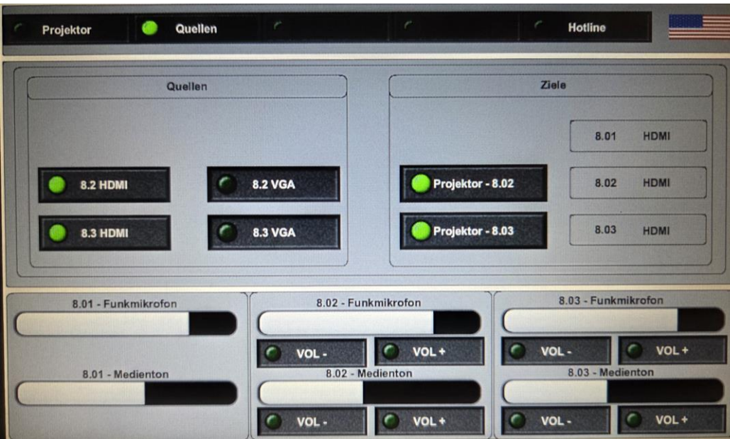
Szenario Auswahl Raum 008.2 und 008.3 Quellen