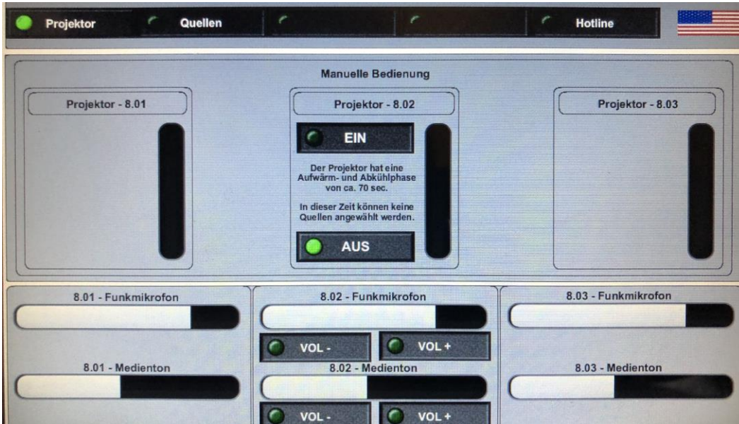
Szenario Auswahl Raum 008.2 Projektor