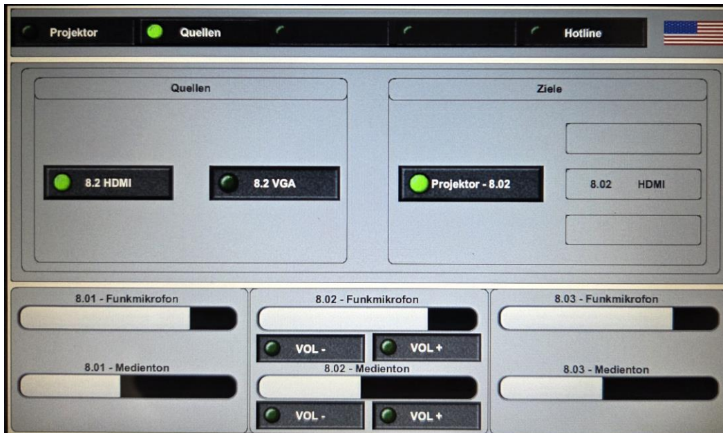
Szenario Auswahl Raum 008.2 Quellen