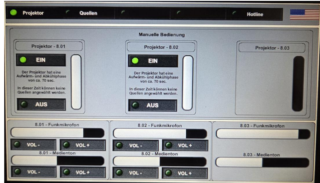
Szenario Auswahl Raum 008.1 und 008.2 Projektor