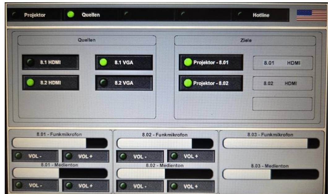
Szenario Auswahl Raum 008.1 und 008.2 Quellen