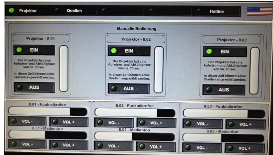
Szenario Auswahl Raum 008.1,008.2 und 008.3 Quellen