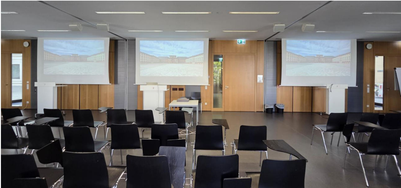
Raumansicht nach vorne