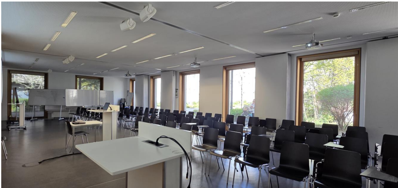
Raumansicht nach hinten