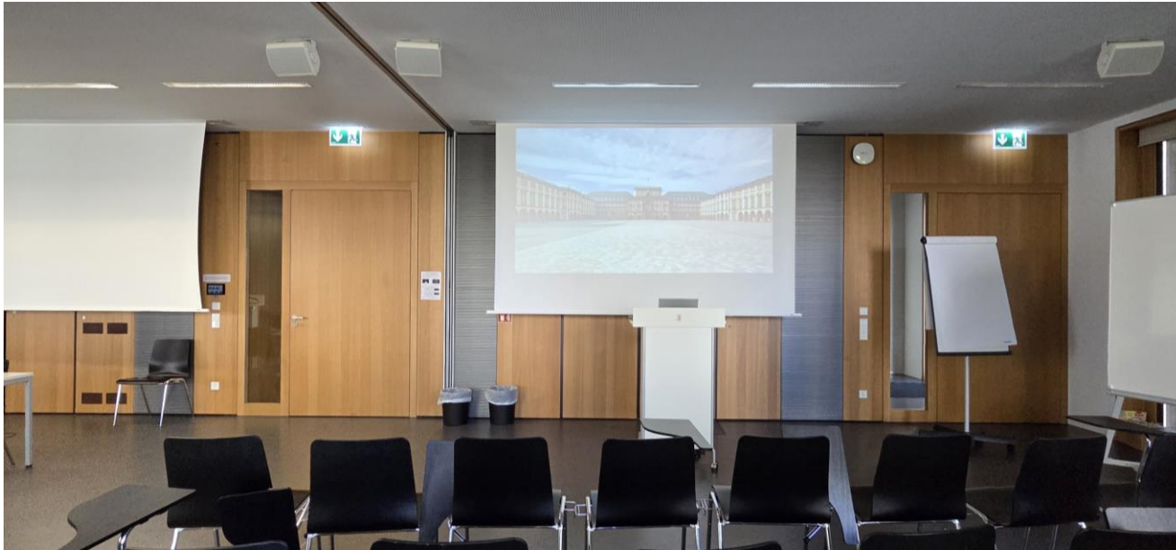
Nutzung mit einem Beamer