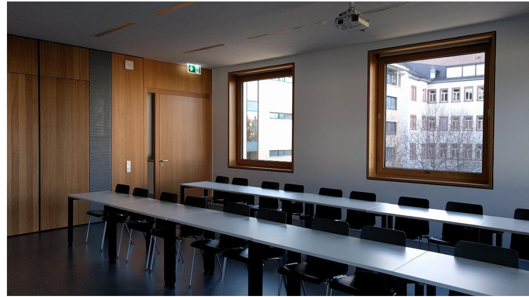
Vorhandene Anschlüsse (HDMI Kabel und Audiokabel bei Bedarf eigene verwenden)