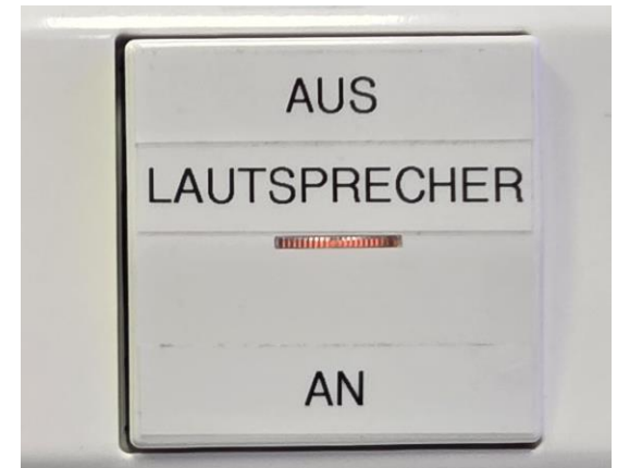
Schalter für Lautsprecher