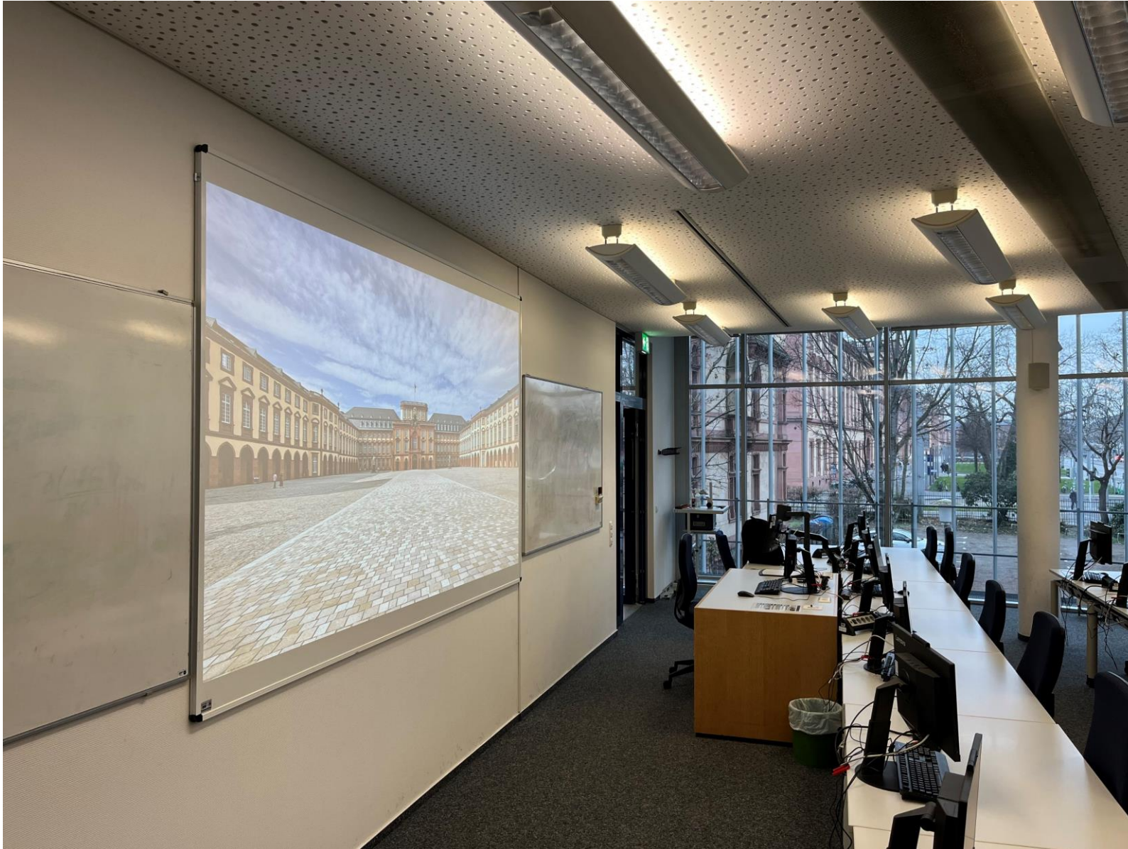
Raumansicht auf Leinwand, Pult und Lautsprecher