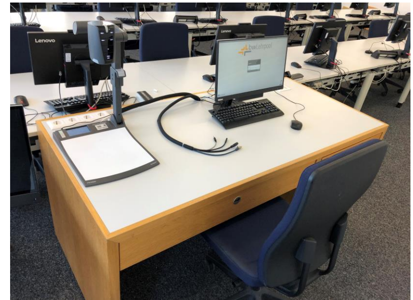
Pult mit All-in-One PC, Visualizer, Bedienfeld & Anschlusskabeln