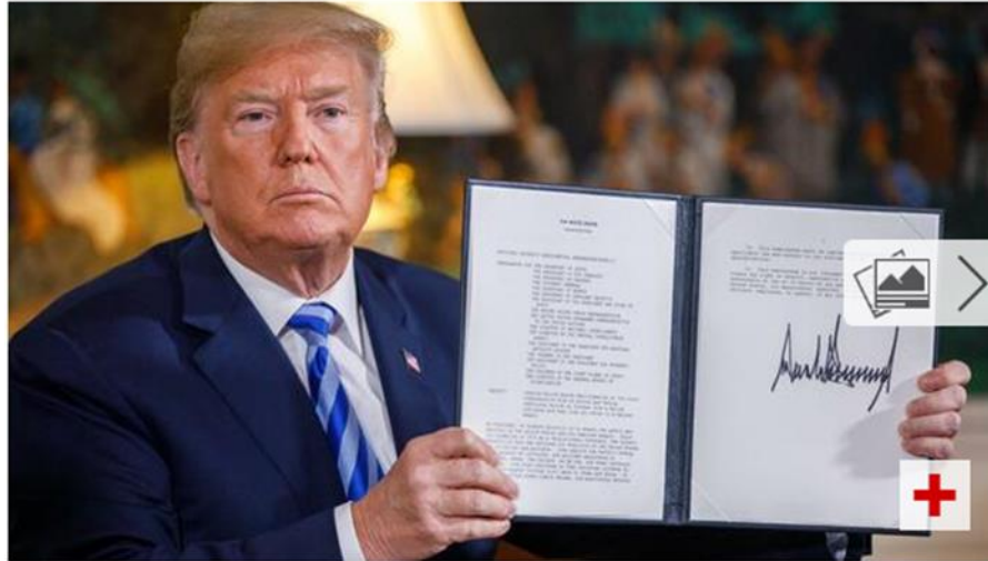
Der Ausstieg. Donald Trump kündigt am 8. Mai 2018 das Atomabkommen mit dem Iran auf.

- US-amerikanisches Sanktionsrecht (als politisches Druckmittel) → Russland, Iran