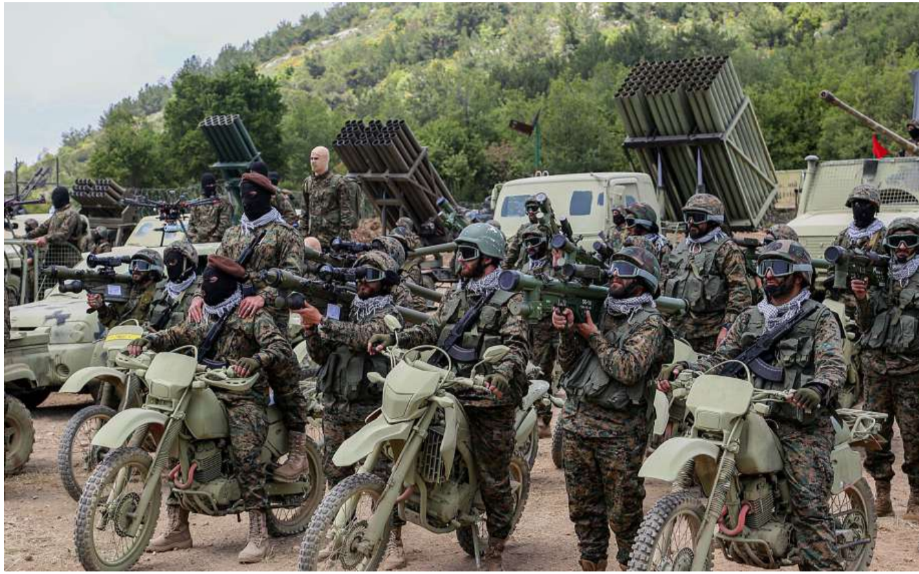
Ausgerüstet mit Geld aus Teheran: Hizbullah-Kämpfer inszenieren im Libanon eine militärische Übung

Der Autor zeichnet die Entstehung der „Achse“ nach. Er beschreibt die Ideologie, die das ungewöhnliche Bündnis zwischen dem Staat Iran und seinen höchst unterschiedlichen nichtstaatlichen Ver-